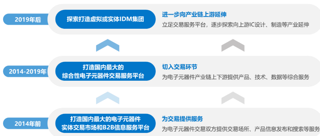
深圳华强战略演进示意图

公司自成立以来，长期深耕电子行业，基于产业发展客观规律，结合公司自身资源禀赋制定并持续优化可持续发展战略，通过多维度的、累进式的创新实践，不断完善、延展公司的产业体系，逐步提升公司的产业价值。自 2014 年底战略转型切入电子元器件交易环节以来，公司围绕发展战略迅速做大做强，营收规模从 2015 年的 20.89 亿元增长到 2022 年的 239.41 亿元，印证了公司发展战略的科学。